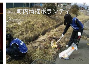
町内清掃ボランティア